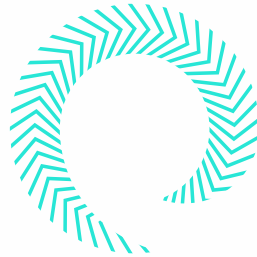
2018 Critical TechWorks